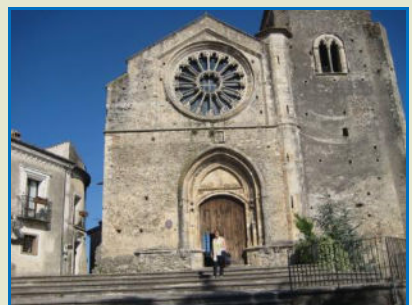
Nelle foto in alto alcune immagini del Borgo di Altomonte e la Chiesa di Santa Maria della Consolazione