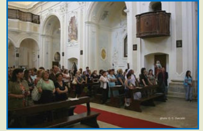
I Soci UCIMM della Provincia durante la celebrazione della Santa Messa