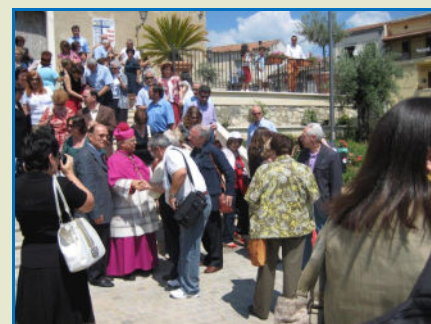
Nelle foto i Soci salutano S.E. Mons. Vincenzo Bertolone sul sagrato della Chiesa