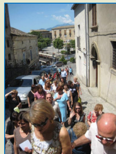
Nelle foto in alto i Soci dopo la Santa Messa visitano il Centro Storico di Altomonte raggiungendo la Sala Razetti per partecipare alla riflessione guidata su San Paolo