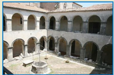
Nelle foto il chiostro del Convento dove è ricavata la Sala Razetti