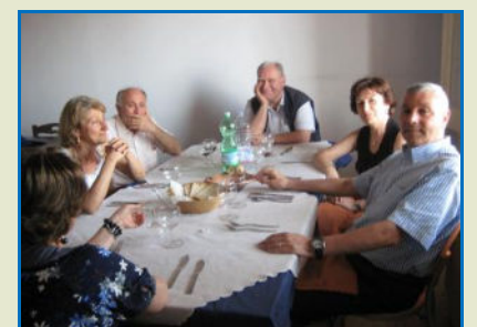
Nelle foto in alto e sotto i Soci durante il momento conviviale al Ristorante "La Locanda del Borgo"