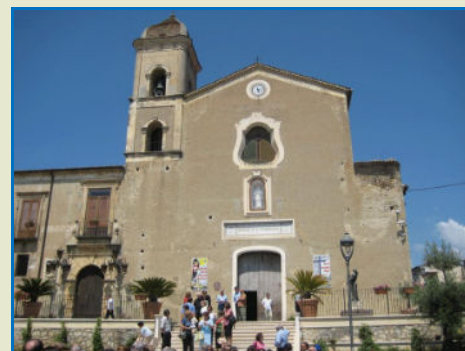
La Chiesa di San Francesco di Paola in Altomonte