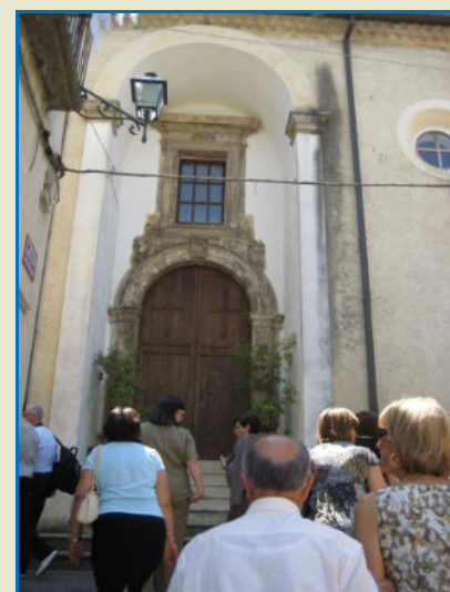
Nelle foto i Soci per le vie del Centro Storico di Altomonte per raggiungere la Sala Razetti e partecipare alla riflessione guidata su San Paolo