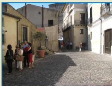
Nella foto in alto un' immagine del Borgo di Altomonte, ai lati l'interno della Chiesa di Santa Maria della Consolazione