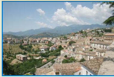
Alcune immagini del Borgo di Altomonte