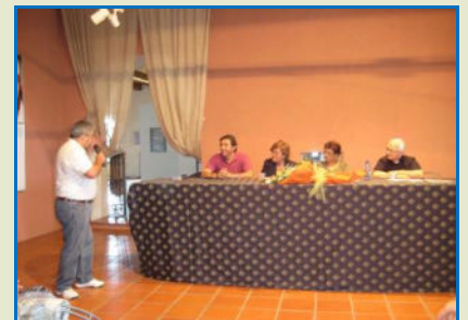
Nelle foto in alto i Soci nella Sala Razetti in alcuni momenti dell'incontro