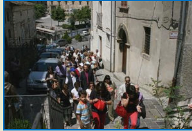
I Soci per le vie del Centro Storico di Altomonte