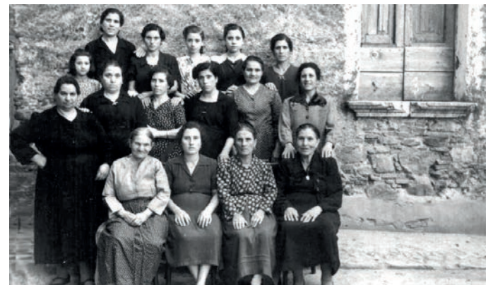
1946: comari del vicinato disposte in ordine gerarchico

anche ciò costituiva una novità. La partecipazione femminile alla vita politica italiana e quindi alla cittadinanza attiva crescevano anche in una regione particolare come la nostra. Quando prese la parola, salutata da fragorosi applausi femminili, Rita Montagnana rilevò che mentre: «Nel 1921 era impossibile riunire un piccolo gruppo di donne, oggi invece esse accorrono spontaneamente a riunirsi ed organizzarsi». «L'Italia - aggiunse - oggi si è trasformata e marcia verso una vita democratica». Continuando nel suo discorso Rita Montagnana affermò: «In questa marcia verso la democrazia le donne sono in prima linea, non solo le donne delle grandi città ma anche le donne meridionali. In Italia il fascismo, asservendo il popolo, aveva maggiormente ribadite le catene dell'oppressione sulla donna... Votate secondo la vostra coscienza - sostenne - tenendo presente che gli uomini che voi mandate ad amministrare devono essere persone oneste ed attaccati agli interessi del popolo».