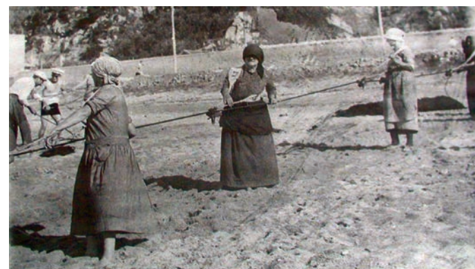
Anni '30: momenti di svago nelle campagne rossanesi

Grazie a tutte le donne che ci hanno permesso di essere quello che siamo, quelle di ieri e quelle di oggi. ●