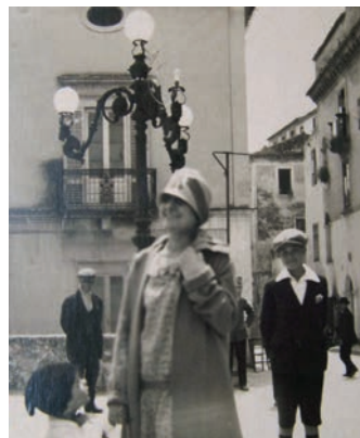
Anni '30: signora elegante in piazza Steri

●● Il diritto all'eleggibilità conquistato con fatica, sangue e lotte sociali. E' un percorso lungo, che fonda le sue radici nell'Italia postunitaria, ma che si concretizza di fatto nel febbraio del '45, grazie a un decreto legislativo luogotenenziale del governo Bonomi, che estende il diritto di voto alle donne. Nel giugno dello stesso anno si permise non solo alle donne di prendere parte, universalmente, al referendum monarchia/repubblica ma anche di votare per le elezioni della Assemblea costituente ed eleggere, come accadde, 21 parlamentari donne, su un panorama politico che andava dalla Democrazia Cristiana al Pci, dai socialisti ai monarchici. La Calabria non fece eccezione e nella provincia di Cosenza si votò il 10, 17, 24 e 31 marzo, ma la campagna elettorale del 10 ebbe un impatto molto più forte e particolare sia perché fu la prima e sia perché fu dopo l'8 marzo giornata mondiale della donna (ricorrenza al tempo politicamente sentita e carica di valore). Nel corso della campagna elettorale che portò al voto del 10 marzo 1946, giunse in provincia di Cosenza Rita Montagnana, moglie di Palmiro Togliatti. Accompagnata da Fausto Gullo, la signora Montagnana Togliatti fece comizi a Rossano, Corigliano, San Demetrio Corone, Spezzano Albanese, Acri, Cosenza e Rogliano. Nei suoi interventi si occupò, in particolare, di riforma agraria e di emancipazione della donna. Furono comizi molto partecipati ed